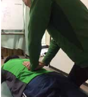
【これまでのセミナー写真】

上肢から起きる症状の原因の説明と、施術を行います。 このセミナーで知識と技術を自分のものにしてしよう!!