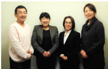
笑顔の練習で使ったラッキー、ミッキー、 ウイスキーを言いながら笑顔で撮影📷

今回で修了試験翌日に開催していました特別企画セミナーは一旦終了となります。特別企画セミナーは終了しますがセミナーを開催してほしいなどの声が多いところから企画していきたいと思っていますのでどしどし事務局まで声をお寄せください。お待ちしております!