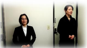
基本の立姿勢。笑顔でいらっしゃいませ!

何事においても大切なことですが、リラクゼーションを求められるセラピストには特に大切なことだと思いました!接客はその接遇の中にあります。まずは接客マナーを身に付けて接客力アップです!!