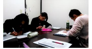
エゴグラムチェック中

自画像と他画像やジョハリの窓のお話や、エゴグラムを使って自己を知ることなど、とても興味深く面白かったです。分かっているようで自分のこと分かってなかったです。自分のことを分かっている方が円滑なコミュニケーションを図り良好な人間関係を維持しやすくなるそうです。ジョハリの窓の開かれた窓を広げられるようになる一つの要因になります。それって何?どういう事?と思われたら次回セミナー受けてみてください。上手く説明できなくてすみません。。